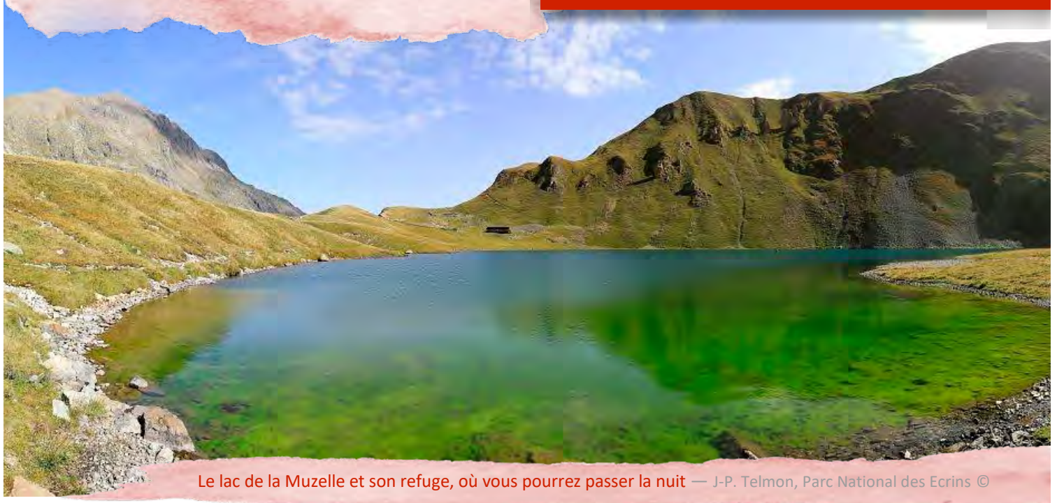
Le lac de la Muzelle et son refuge, où vous pourrez passer la nuit

Jour 2 : 4 h 30 10.8 km D+ 453 m, D- 1726 m