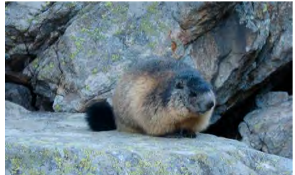
Marmotte du Lauvitel – Christophe Delaere (CC-BY)

Créée en 1995, la zone est depuis interdite d'accès en dehors des personnes impliquées dans les suivis scientifiques. Son classement a permis la réalisation d'un premier état des lieux entre 1995 et 2000 pour connaître au mieux sa biodiversité et les milieux présents. Plus de 3200 espèces y ont été répertoriées. Depuis, des relevés sont régulièrement effectués pour comprendre l'évolution des écosystèmes de la zone : faune, flore, forêt, hydrologie, climat,... tous ces paramètres sont étudiés précisément.