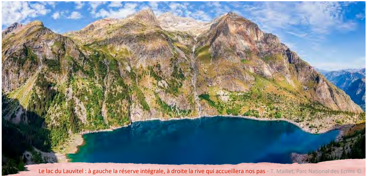
Le lac du Lauvitel : à gauche la réserve intégrale, à droite la rive qui accueillera nos pas