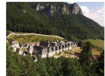
Musée de la Grande Chartreuse