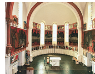
Musée Arcabas en Chartreuse