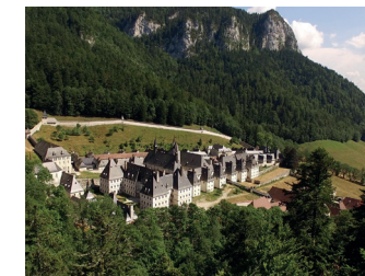
Musée de la Grande Chartreuse