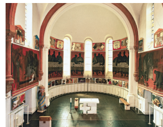
Musée Arcabas en Chartreuse

Informations et autres idées de visites sur www.chartreuse-tourisme.com/rsf ou sur la carte de la Route des Savoir-Faire et des Sites Culturels (disponible gratuitement dans les offices de tourisme du massif).