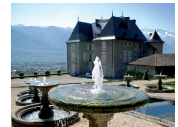
Jardins et château du Touvet