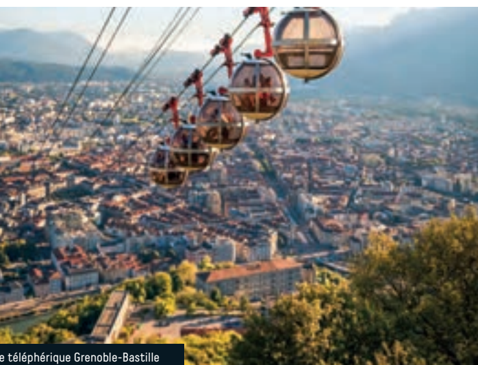
Le téléphérique Grenoble-Bastille

Face à l'église Saint-Louis consacrée en 1699, ces deux immeubles, dits « des éléphants », édifiés après 1900 sont caractéristiques de l'architecture de fausse pierre. Hormis les rez-de-chaussée, les décors de façades sont tous réalisés en ciment moulé. Même les briques sont fausses !