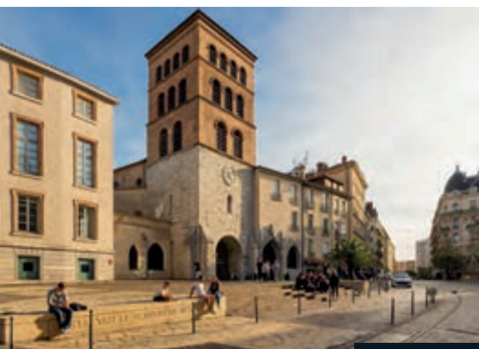
Place Notre Dame