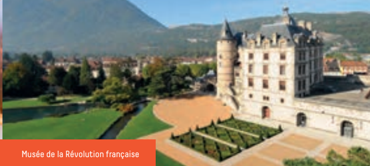
Musée de la Révolution française

Musée archéologique de Grenoble église Saint-Laurent (D1) Place Saint-Laurent - Tél. : +33(0)4 76 44 78 68 - www.musee-archeologique-grenoble.fr Musée archéologique et crypte Saint-Oyand du IV e siècle. Horaires : ouvert tous les jours sauf le mardi, 10h-18h. Fermé les 1 er janvier, 1 er mai et 25 décembre.