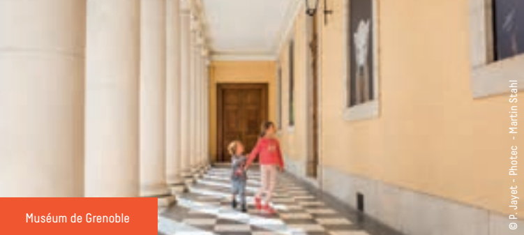
Muséum de Grenoble

La Casamaures d'hier et d'aujourd'hui (B1) 58, allée de la Casamaures - Saint-Martin-le-Vinoux Tél. : +33(0)9 50 71 70 75 - www.casamaures.org Monument historique orientaliste en ciment moulé (or gris) du XIX e siècle. Horaires : ouvert le premier samedi de chaque mois à 14 h. Plein tarif : 8 €. Plein réduit : 5/6 €.