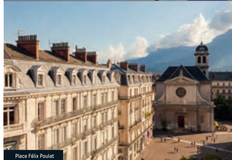
Place Félix Poulat