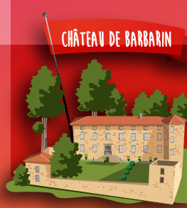
CHÂTEAU DE BARBARIN

1245 route du château - 38730 Virieu www.chateau-de-virieu.com / accueil.virieu@gmail.com Visites et manifestations d'avril à octobre.