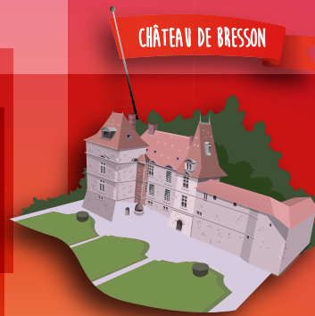
CHÂTEAU DE BRESSON