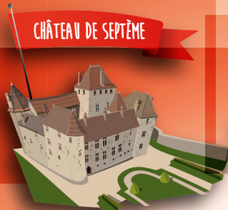
CHÂTEAU DE SEPTÈME