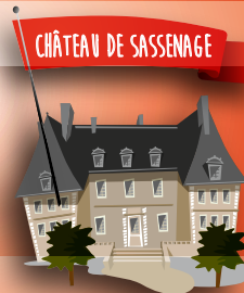
CHÂTEAU DE SASSENAGE