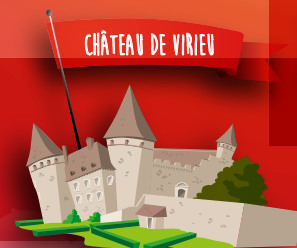
CHÂTEAU DE VIRIEU