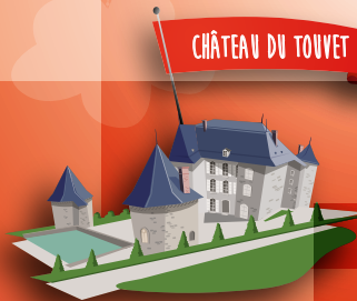
CHÂTEAU DU TOUVET