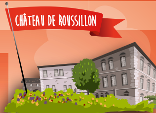
CHÂTEAU DE ROUSSILLON