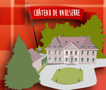
CHÂTEAU DE VAULSERRE